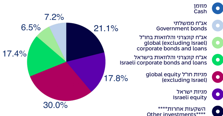
הרכב נכסים במונחי שווי ליום 30/11/2025 Composition of assets, by exposure, as of 30/11/2025

סה"כ נכסים בלתי סחירים: 29.3% Total private assets: