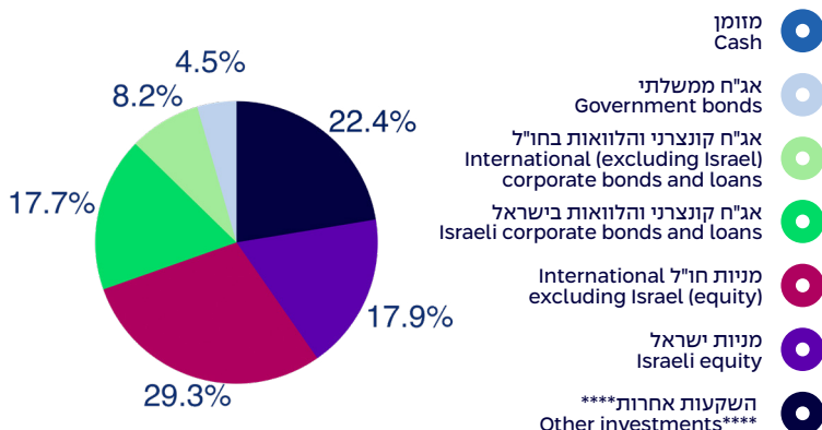
הרכב נכסים במונחי שווי ליום 30/6/2025 Composition of assets, by exposure, as of 30/6/2025

סה"כ נכסים בלתי סחירים: 31.0% Total private assets